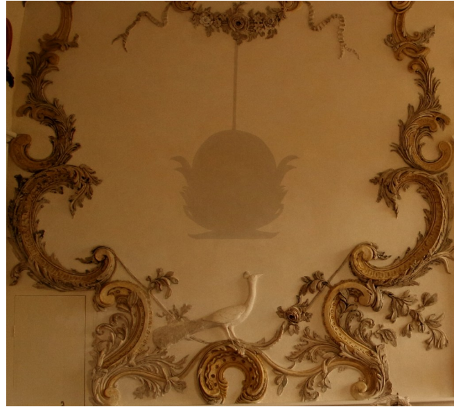
Le paon et le fantôme d'un trophée.

Au dessus du paon, le fantôme d'un trophée. Les trophées étaient des bas reliefs en gypse (instruments de musique, fleurs, tableaux de chasse), ils étaient suspendus (en apparence) au centre des panneaux. Les quatre ont été supprimés dès le 18ème siècle et nous n'avons aucun indice quant à ce qu'ils représentaient.