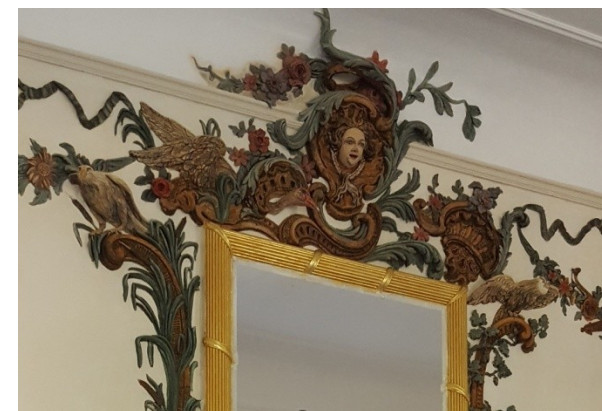
La demeure de Diane

nine qui porte en diadème un croissant de lune. Ce diadème est caractéristique de la représentation féminine en Diane dans la première moitié du 18 ème siècle. Les attributs de la déesse de la clarté lunaire, de la famille, plus connue comme déesse de la chasse sont distribués à l'entour, oiseaux, chiens, arcs, flèches. De nombreux végétaux, feuilles et fleurs, s'y ajoutent pour former un tableau foisonnant.